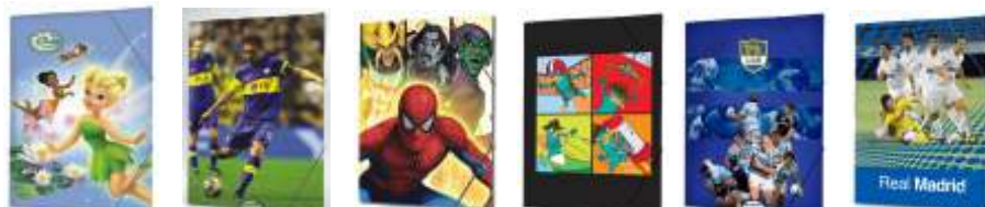
263-519 carpeta 3 solapas