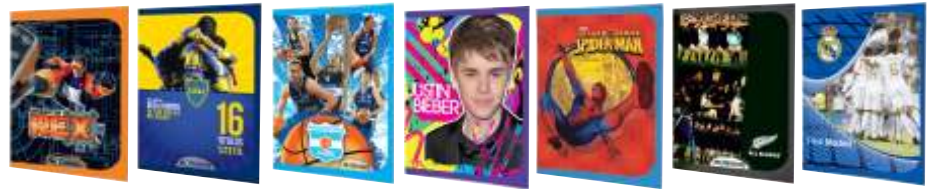
263-201 Cuad T/F x48