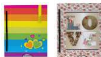
263-520 Carpeta N'3