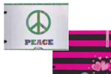
263-521 Carp N'5