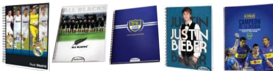
263-210 Cuad 29/7 x 80