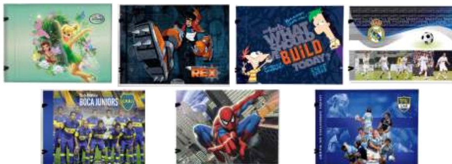
263-511 Carpeta N' 5 Cartone