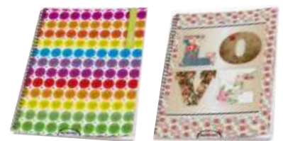
263-211 Cuad 29/7 x 80