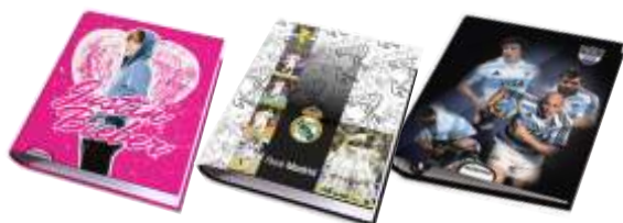
263-515 Carpeta A4 2x40