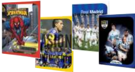
263-200 Cuad T/F x 24