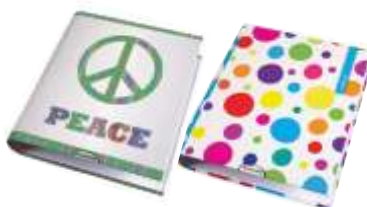
263-516 Carpeta A4 2x40